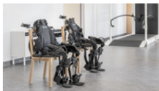
ExskoNR - Exoskelett