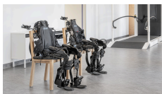
EksoNR - Exoskelett